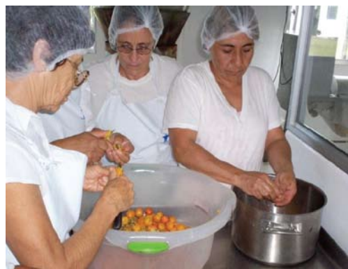
Figura 9. Clasificación de la fruta.