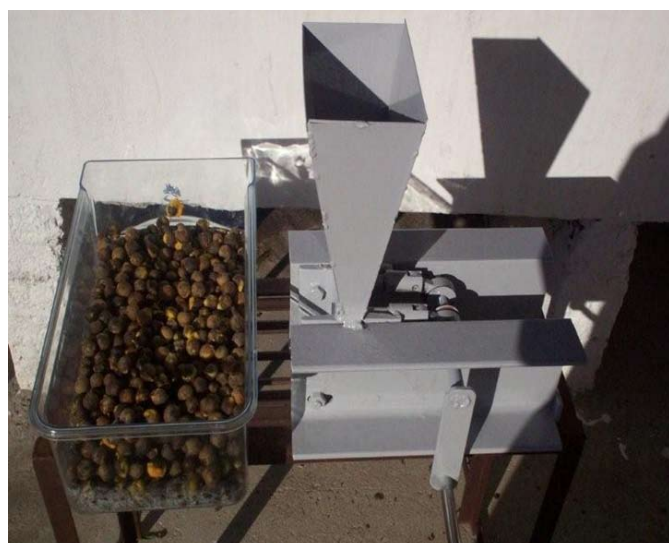
Figura 5. Rompedor mecánico del endocarpo leñoso.