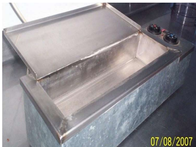
Figura 7. Templadora de chocolate.

El equipo presenta las siguientes características: bajo costo de construcción y de consumo eléctrico, capacidad adecuada y condiciones de trabajo y de manipulación aptas para el manejo del tipo de producto a utilizarse. Cuenta con una resistencia eléctrica que posee dos termostatos independientes. Uno que permite derretir el chocolate sin pasarlo de temperatura y otro que después de sembrarlo permite un adecuado templado. Se construyó en acero inoxidable de uso alimenticio y es perfectamente lavable e higienizable. Su tamaño está definido para pequeños usos, pudiendo trabajar hasta 3 kg de chocolate cada vez. El equipo diseñado se muestra en la Figura 7, y en la Tabla 3 se presentan los parámetros operativos.