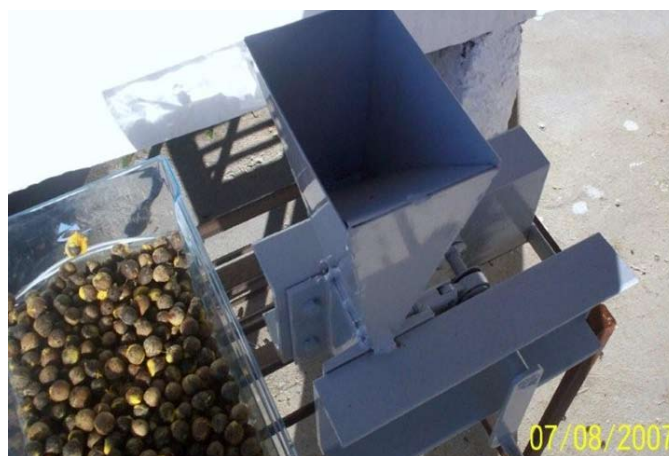
Figura 4. Rompedor mecánico del endocarpo leñoso.

Vale aclarar que el equipo se encuentra aún en su fase experimental, debido a la búsqueda de materiales más económicos para su diseño y fabricación. El equipo se muestra en las Figuras 4 y 5, y en la Tabla 2 se presentan los parámetros operativos. El producto obtenido (almendras) se muestra en la Figura 6.