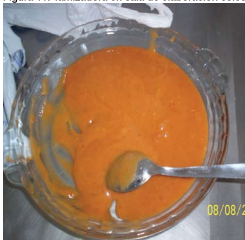
Figura 12. Pasta de butiá para rellenar bombones.