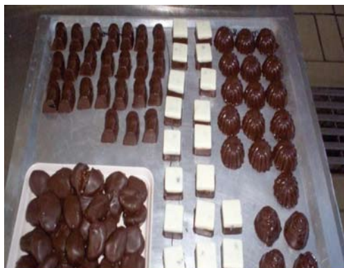
Figura 15. Bombones terminados.