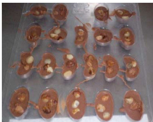
Figura 16. Uso de la almendra como relleno de bombones.