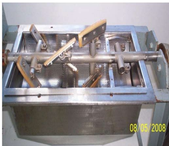
Figura 3. Tamizadora

El diseño alcanzado permite que los coquitos salgan enteros sin presentar roturas, si la fruta butiá está en buen estado sanitario y bien clasificada por tamaño. En caso de producirse rotura de los coquitos, la pulpa presentaría sabores amargos impropios de la fruta y presencia de trozos no comestibles en los productos terminados. En la Figura 3 se presenta el equipo diseñado y en la Tabla 1 los parámetros operativos.