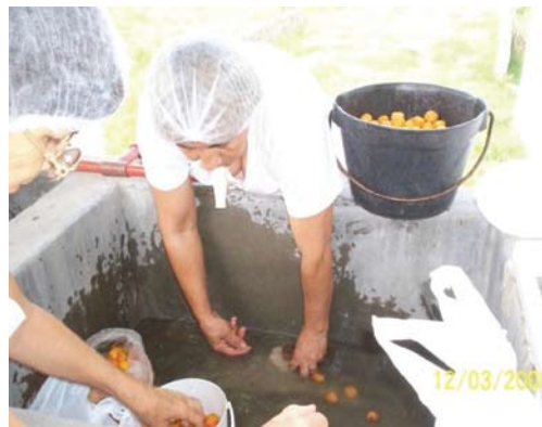
Figura 8. Lavado de la fruta.

Se pretende mostrar las diferentes etapas del proceso de obtención de relleno para bombones, obtención de almendras y elaboración de los bombones y la utilización de los equipos diseñados.