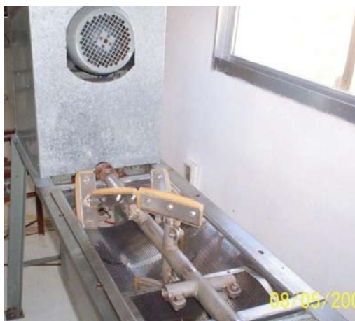
Figura 11. Tamizadora en sala de elaboración colectiva.