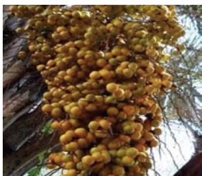
Figura 1. "Cacho de butiá".

de butiá (Figura 1). Presentan un corazón, el endocarpo leñoso, conocido localmente como coquito (Figura 2), extremadamente duro. Este coquito casi esférico, de aproximadamente 15 mm de diámetro, contiene las semillas conocidas popularmente como almendras (Pereira et al. 2008). Los productos comestibles aprovechables del butiá son la pulpa y las almendras.