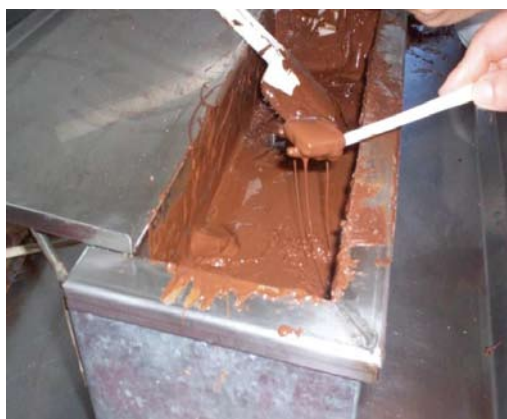
Figura 13. Templadora de chocolate en uso.