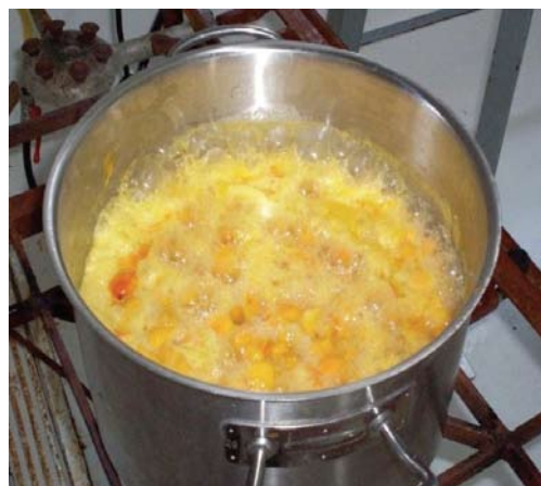
Figura 10. Cocción de la fruta.