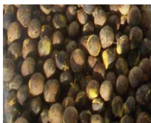
Figura 2. Coquitos de butiá.

En los últimos años, el LATU ha estado trabajando con elaboradores de la zona y ONG's en el desarrollo de productos a base de butiá. Este proceso se desarrolla con la colaboración de la Intendencia Municipal de Rocha, de forma de aunar esfuerzos y recursos con el propósito de rescatar los saberes locales y de incorporar la tecnología apropiada que permita desarrollar, adecuar y/o mejorar productos de buena calidad para la pequeña producción artesanal.