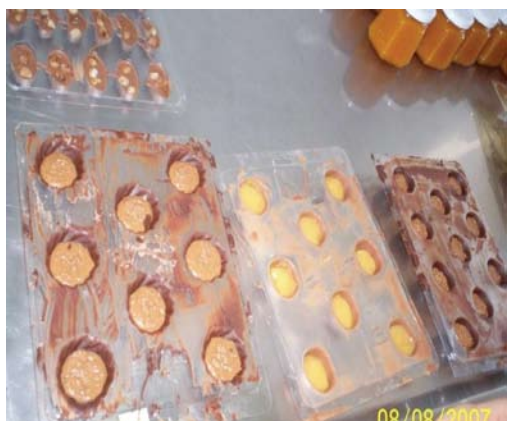
Figura 14. Proceso de relleno de bombones con pasta de butiá.