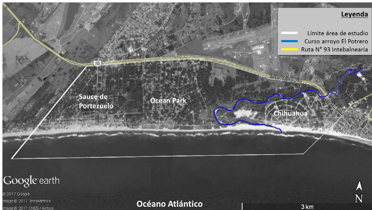
Figura 2. Área de estudio; se muestran los balnearios costeros que la conforman, el curso del arroyo El Potrero y la ruta Interbalnearia N° 93.

El diagnóstico integrado se elaboró a partir del relevamiento de información secundaria (informes: 11, reportes: 2, libros: 2, archivos de prensa: 2, censos nacionales: 1, artículos publicados en revistas: 3, tesis de posgrado: 2); la generación de información primaria a partir de entrevistas semi-estructuradas a diferentes actores vinculados a la zona (actores gubernamentales: 1, asociaciones vecinales: 4, empresarios inmobiliarios: 4, academia: 2) y dos recorridos de reconocimiento en terreno. Las entrevistas fueron realizadas entre mayo y octubre de 2015 con el objetivo de conocer los principales asuntos de relevancia en el área según la percepción de cada actor social. Previo a las entrevistas se elaboraron preguntas guía con temáticas amplias que era de interés abordar con cada entrevistado. Estas temáticas fueron definidas a partir del relevamiento previo de información secundaria sobre el sitio. El carácter semi-estructurado de las entrevistas permitió que se estableciera un diálogo en el que, además de los temas de interés para el grupo de trabajo, se desarrollaran nuevos aspectos incorporados por cada entrevistado según sus intereses (Valles, 1997). El intercambio fue grabado con el consentimiento del entrevistado y fue transcrito; se tomó